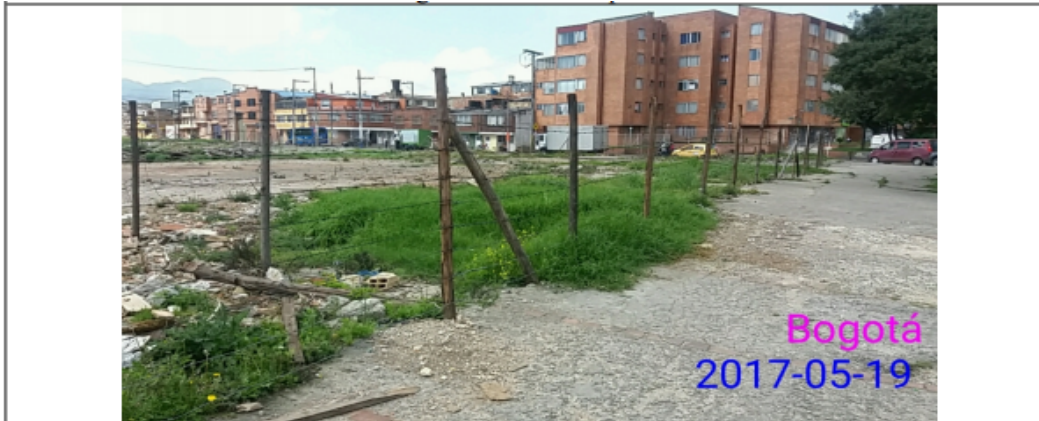
FOTOGRAFIA 2: Vista del predio CALLE 63 BIS No. 71 C – 54, en donde no se encuentra instalado ningun elemento de publicidad exterior visual.