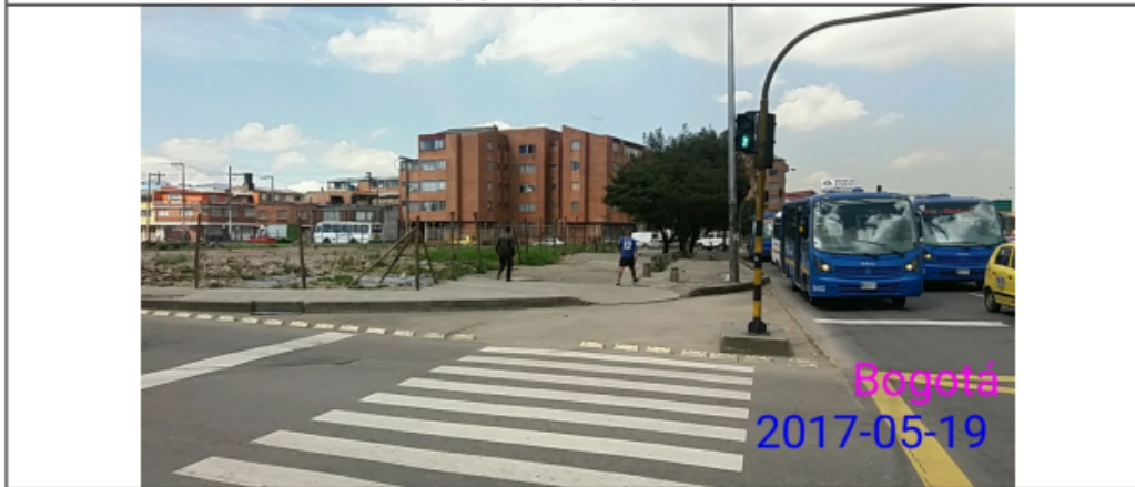
FOTOGRAFIA 3: Vista del predio CALLE 63 BIS No. 71 C – 54, en donde no se encuentra instalado ningun elemento de publicidad exterior visual..